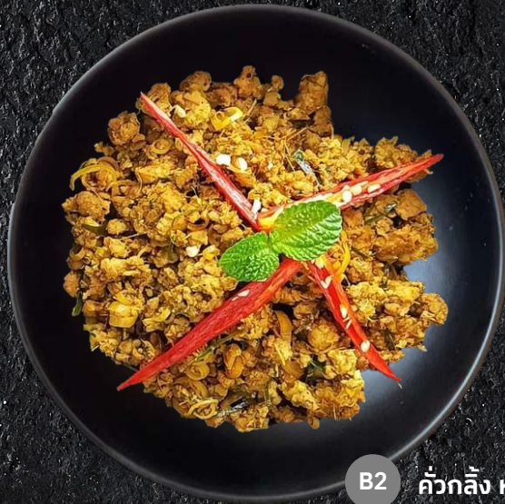
B2 คั่วกลิ้ง หมู/ไก่ Stir Fried Pork/Chicken Yellow Curry Paste 109.-