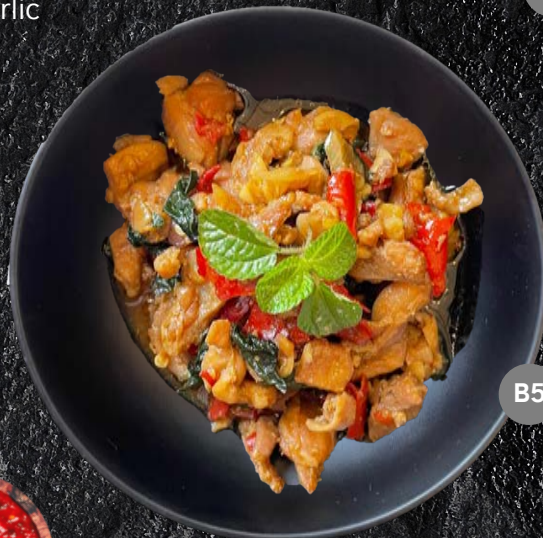
B5 ผัดกะเพรา [ไก่] Stir Fried Chicken and basil 90.-