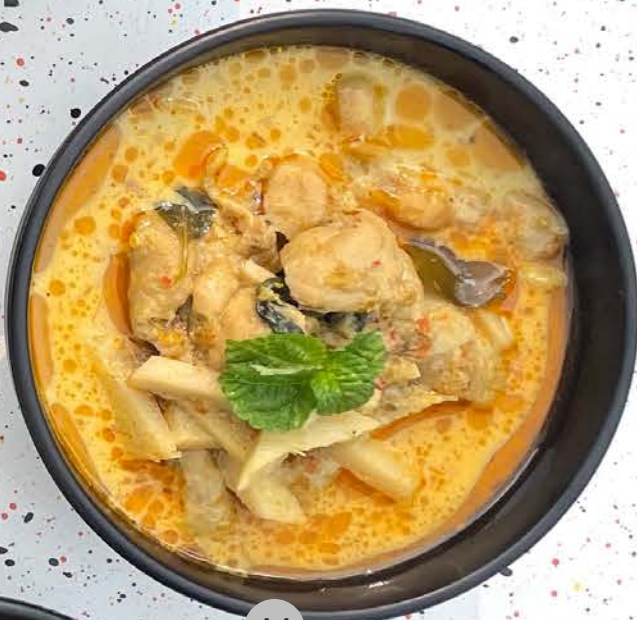
A4 แกงเขียวหวานไก่