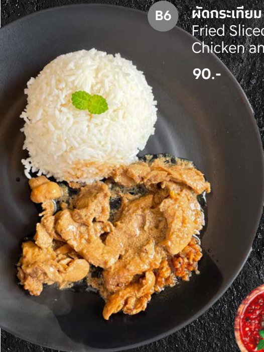
B6 ผัดกระเทียม [ไก่] Fried Sliced Chicken and Garlic 90.-