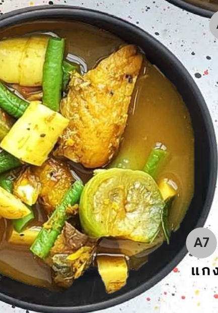
A7 แกงไตปลา