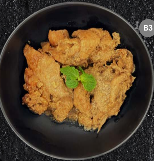
B3 ผัดกระเทียม [หมู] Fried Sliced Pork and Garlic 90.-