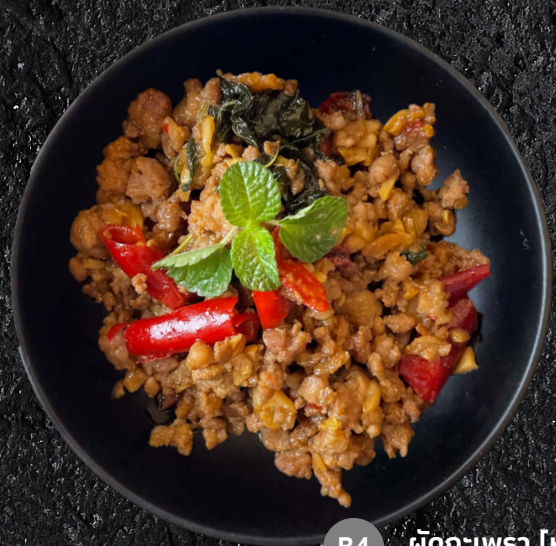
B4 ผัดกะเพรา [หมู] Stir Fried Pork and basil 90.-