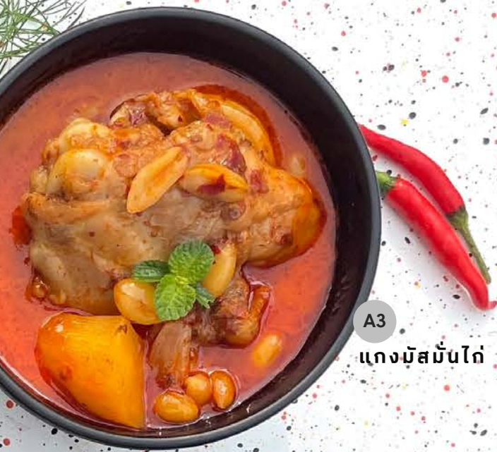
A3 แกงมัสมั่นไก่